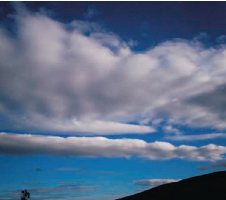
Panorámica región de Villa de Leyva, Boyacá, Colombia.