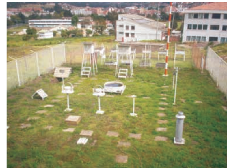
Estación meteorológica del IDEAM, Universidad Pedagógica y Tecnológica de Colombia, Tunja, Boyacá.

Los datos para obtener los indicadores agrometeorológicos, serán obtenidos por mediciones directas en las estaciones meteorológicas, y a través de las instituciones que las poseen. Además, junto con la información suministrada por terceros y relacionada de alguna manera con la PA, se construirán modelos de manera automática, que indiquen relación, detalle, descripción. Es decir, que se pueda conocer la distribución de los datos, para cada una de las Bases de Datos (BD) correspondiente a los indicadores agrometeorológicos, de tal manera que, los algoritmos o técnicas de la MD, permitan ganar en eficiencia, manejabilidad, tiempo y economía.